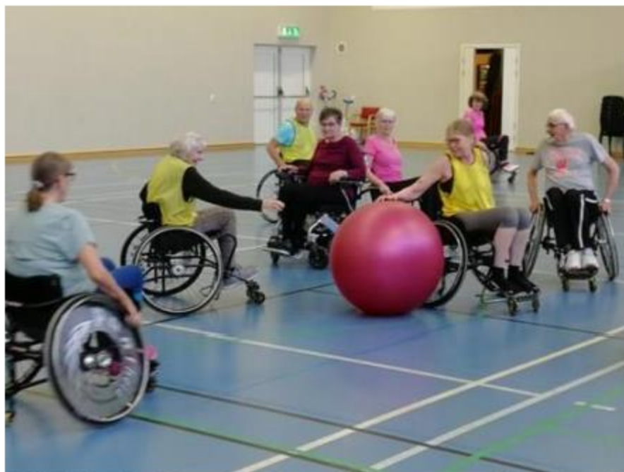
Fläskboll där samtliga fick prova på rullstol.

5 dagar med 22 deltagare 3 dygn med 17 deltagare