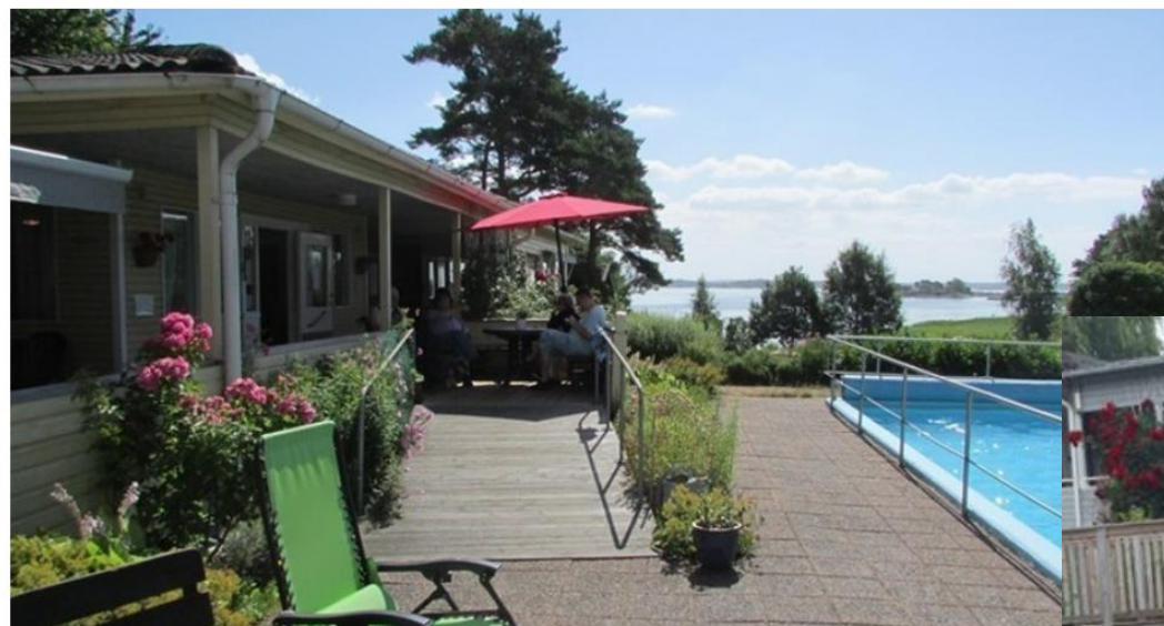
Strannegården, Onsala.