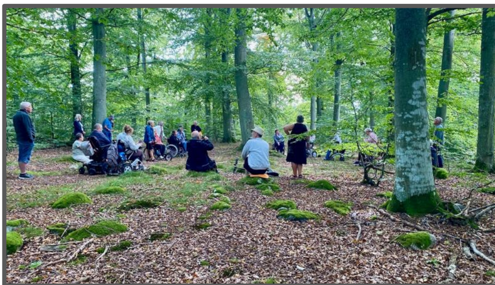
Skogsbad i bokskogen i Valjeviken