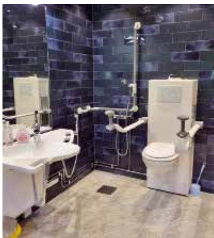
Kanske Sveriges flottaste uppvärmda utomhus-toalett!

Rune har byggt ett lyxigt hus med toalett som har alla moderna funktioner för dem som kan behöva lite extra support, bara dasset är värt ett besök!