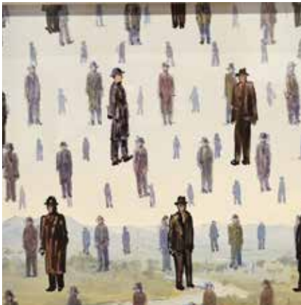
Den alltid välklädde Magritte

Han var själv nyfiken och ville få betraktaren att inte bara titta utan även fundera på vad det egentligen var han såg. En av surrealismens mästare som alltid (?) gick välklädd i kostym och målade fredsduvor bland lätta fjädermoln.