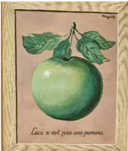
Det här är inget äpple. Sant får man väl erkänna!