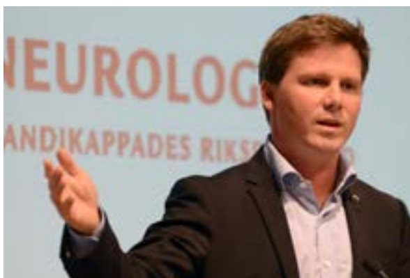
Integrationsminister Erik Ullenhag gästade Neuroförbundets kongress i september.

Ny logotype och grafisk profil antogs också. Beslutet om namnbytet gäller för hela organisationen, men lokalföreningar, länsförbund och distrikt måste formellt klubba namnbytet på sina respektive års- och ombudsmöten. Förutom namnbytet beslutade kongressen om en handlingsplan för kommande kongressperiod, som är fyra år. Fokus i planen är på neurosjukvård, arbete, rättigheter och framtidens Neuroförbund. En ny styrelse valdes med 10