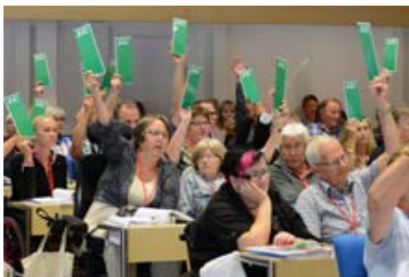
Representanter från hela landet beslutar om förbundets framtida inriktning och verksamhet för de kommande fyra åren.