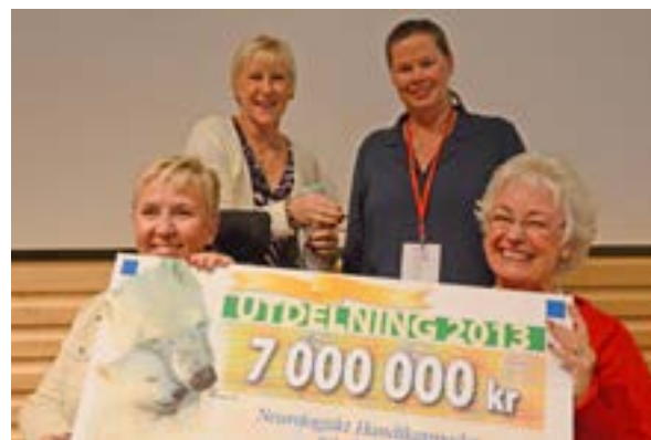
Margot Wallström kom till kongressen och lämnade Postkod-Lotteriets check på 7 MSEK till BrainBus-projektet.