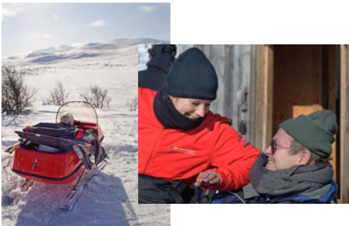
Saxnäs fjällen är ett uppskattat resmål då Neuroförbundet anordnar sina vinterveckor. Ett välkommet avbrott från vardagen blir ett livslångt minne med uppskattade möten, samtal och upplevelser.

Förbundet anordnade under 2013 medlemsaktiviteter som vinterveckor i Saxnäs fjällen, familjeläger på Valjeviken och diagnos- och relationskurser över en helg. Att låta hela familjer delta på olika aktiviteter, inte minst barn till någon med neurologisk diagnos, är en inriktning som förbundet kommer att fortsätta utveckla.