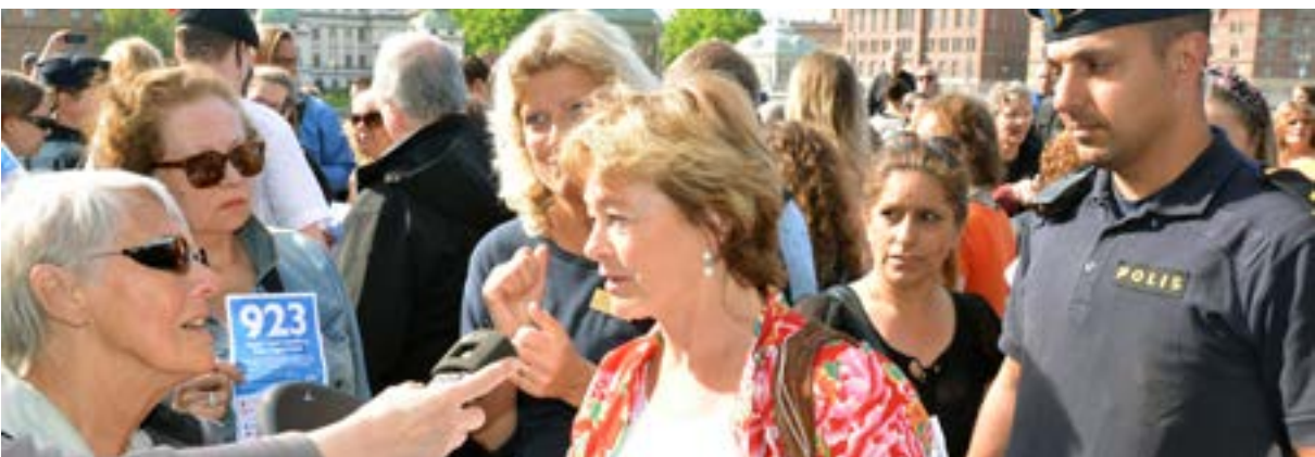
Kultur- och idrottsminister Lena Adelsohn Liljeroth var en av flera ministrar som tog emot Neuroförbundets budskap om diskrimineringslag som framgångsrikt drevs under många torsdagsaktioner utanför regeringskansliet Rosenbad.

Samtidigt med förbundets publicering av rapporten agerade ett 10-tal föreningar med lokala och regionala insändare, som gav gensvar runt om i landet. Resultatet har varit en rad uppföljande kontakter från taxibranschen och ansvariga myndigheter. De vill ta del av Neuroförbundets erfarenheter i sitt fortsatta arbete för att utveckla färdtjänsten.